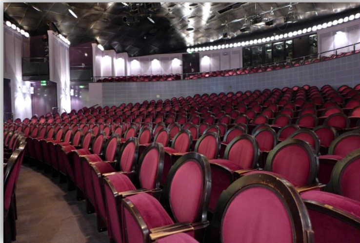
Saal des Winterhuder Fährhauses