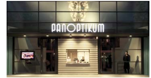
15 Stars & Sternchen Panoptikum + Theaterbesuch