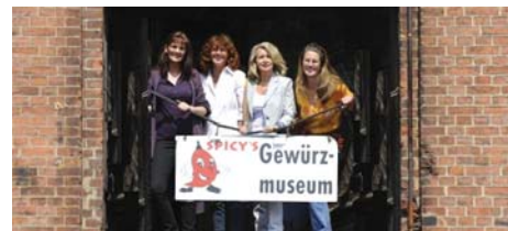
09 Ein rundum würziger Tag Spicy's Gewürzmuseum + Theaterbesuch