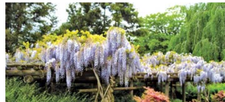
05 blumig & komödiantisch PLANTEN UN BLOMEN + Theaterbesuch

erleben Sie beste Unterhaltung in der Komödie Winterhuder Fährhaus und entdecken Sie zudem Hamburg in seiner ganzen Vielfalt. Dank der Zusammenarbeit mit unseren zahlreichen Kooperationspartnern profitieren Sie von exklusiven Gruppenangeboten und Sonderkonditionen. Lassen Sie sich auf den folgenden Seiten inspirieren. Wir freuen uns auf Ihren Besuch!