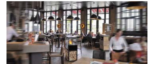
19 Kulinarisches & Komödie Restaurant + Theaterbesuch