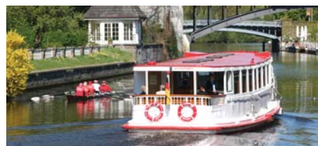
11 Dampferfahrten & Theater Alstertouristik ATG + Theaterbesuch