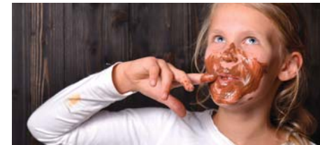
17 Hamburg von der süßen Seite CHOCOVERSUM + Theaterbesuch