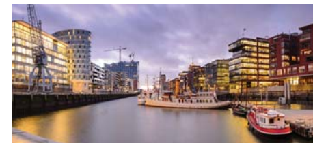
23 Weltkulturerbe & Moderne SPEICHERSTADT + HAFENCITY + Theaterbesuch