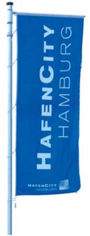
Lena Ivashkevich / Shutterstock.com