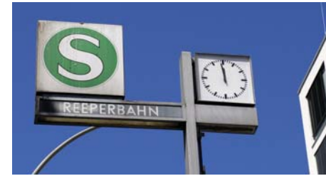
13 Kiez & KulTour St. Pauli Museum + Theaterbesuch