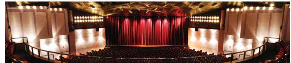
21 Exklusiver Blick hinter die Kulissen Komödie Winterhuder Fährhaus + Theaterbesuch