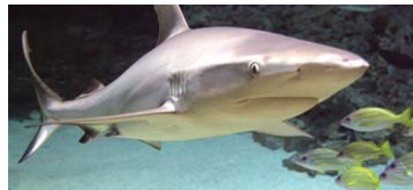
07 Tropen & Komödie Tropen-Aquarium + Theaterbesuch